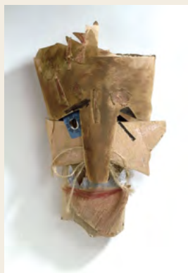
↓ Marcel Janco Maschera 1919