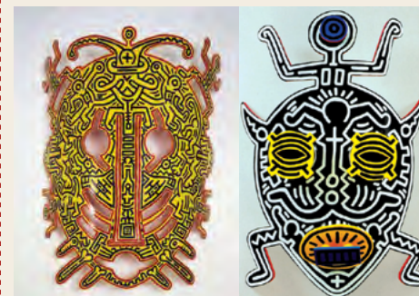
↓ Keith Haring Maschere 1987-88