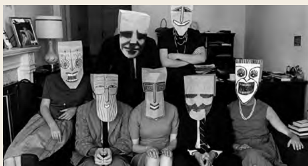
↓ Saul Steinberg Ritratto di gruppo con maschere 1962