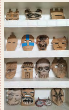
→ Taring Padi Maschere 2022