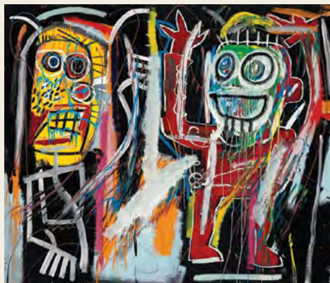
↓ Jean-Michel Basquiat Dusthead 1982