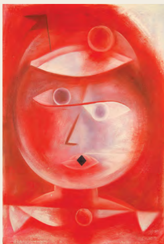
→ Paul Klee Maschera con bandierina 1925