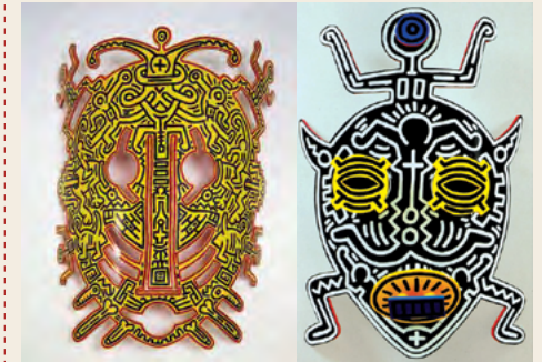
↓ Keith Haring Maschere 1987-88