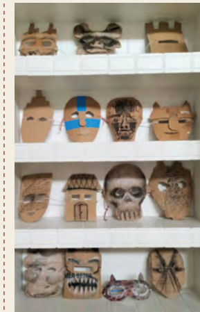
→ Taring Padi Maschere 2022