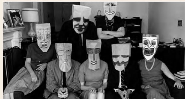
↓ Saul Steinberg Ritratto di gruppo con maschere 1962