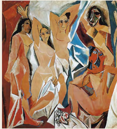
→ Pablo Picasso Les Femmes d'Alger (O. J.) 1907

DA DOVE VIENI? Viaggi tra maschere e totem