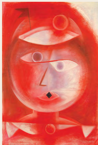
→ Paul Klee Maschera con bandierina 1925