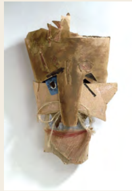
↓ Marcel Janco Maschera 1919